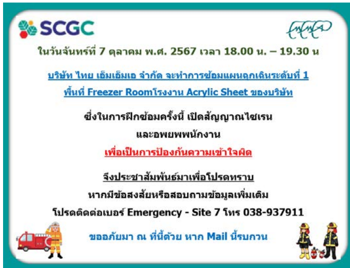
Table Top Exercise